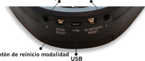
Botón de reinicio modalidad