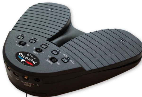
Botón de reinicio Bluetooth

Cuando esté emparejado, parpadeará una sola luz lentamente en el pedal.